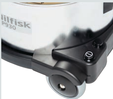
Kaksi toimintanopeutta tietyissä malleissa