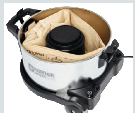
Kestävä terässäiliö ja 15 litran pölypussi