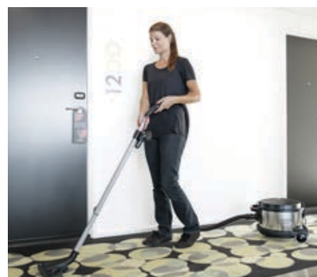
VP930 on rakennettu erityisesti kohteisiin, joissa siivouksen tulee tapahtua mahdollisimman hiljaisesti: sen äänenpainetaso on alimmillaan 58 dB(A).