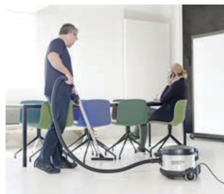
VP930 on täydellinen valinta vaativiin käyttökohteisiin, kuten konttoreihin, hotelleihin ja julkisiin rakennuksiin.