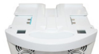
i-charge 9 K.1.S.72.0344.0