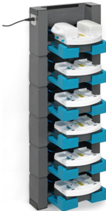
i-stack 6 6 kerrosta