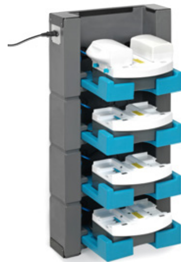
i-stack 4 4 kerrosta