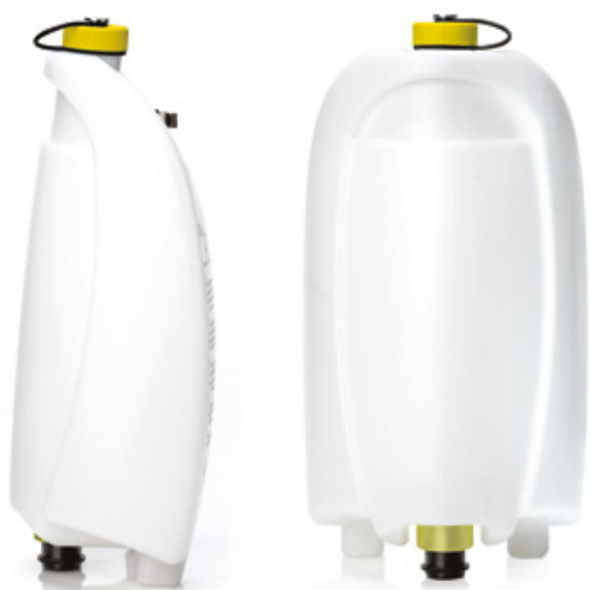
Puhdasvesisäiliö, keltainen ● pesutilojen pinnat