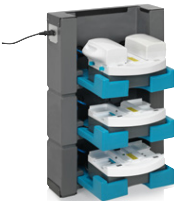
i-stack 3 3 kerrosta

Tilanpuute on nykyään yleistä. Käytössä olevaa säilytystilaa ei voi tuhlaata senttiäkään. Siksi ajattelimme, että kannattaisi hyödyntää seinätilaa akkujen latauksessa. Useaa laturia kohden tarvitaan vain yksi pistorasia. Voit kiinnittää, kytkeä ja ladata akut menettämättä arvokasta hyllytilaa.