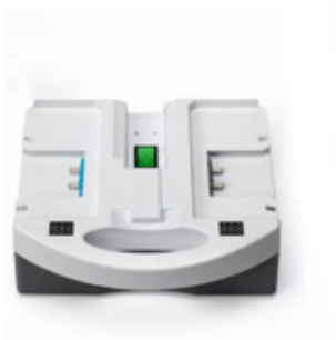
i-charge 2 K.1.S.72.0299.0