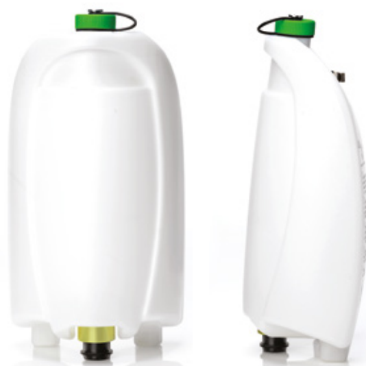
Puhdasvesisäiliö, vihreä ● elintarvikkeiden käsittelyalueet ja baarit