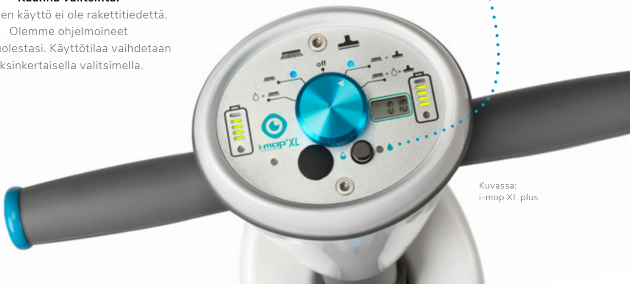
Kuvassa: i-mop XL plus

Laitteen käyttö ei ole rakettitiedettä. Olemme ohjelmoineet sen puolestasi. Käyttötilaa vaihdetaan yksinkertaisella valitsimella.