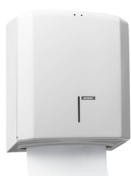
988113 Katrin Käsipyyheannostelija Metallinen, Valkoinen