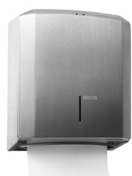
988366 Katrin Käsipyyheannostelija Metallinen, Harjattu Teräs

Kansainvälinen valikoima. Markkinakohtainen saatavuus löytyy tuotesivuilta.